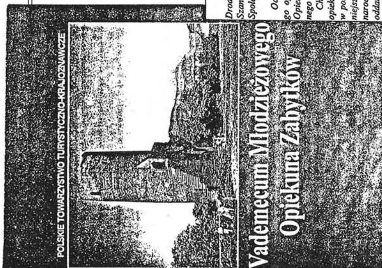
POLSKIE TOWARZYSTWO TURYSTYCZNO-KRAJOZNAWcze