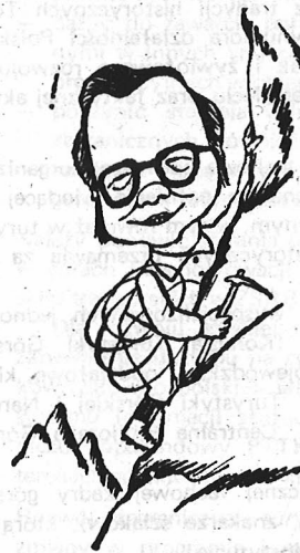
rys. ERYK LIPiŃSKI

Możliwość realizacji podjętych decyzji jest uzależniona od zmiany wielu przepisów państwowych krępujących dotychczas rozwój turystyki górskiej.